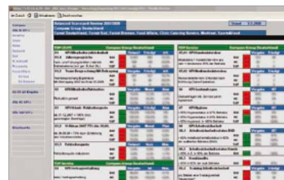
KONSOLIDACE NA FIREMNÍ ÚROVNI